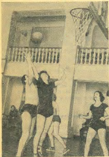
Момент игры у кольца.