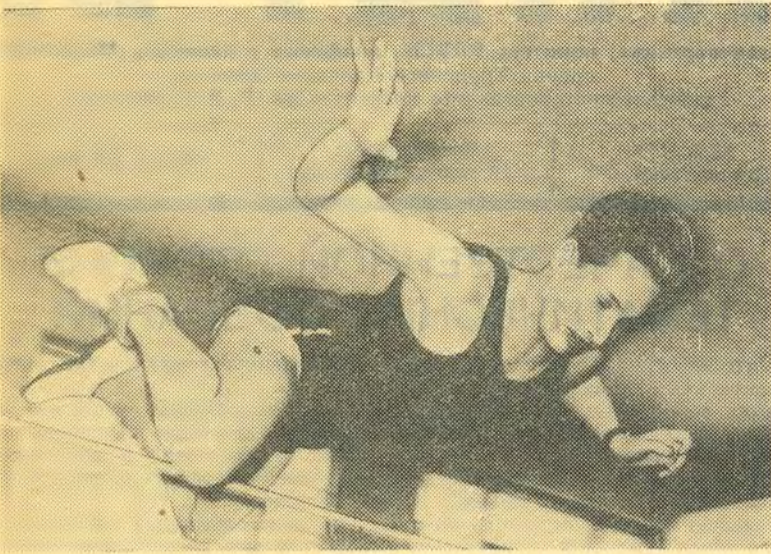
Прыжок в высоту.